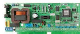
Контрольная панель Норд-4