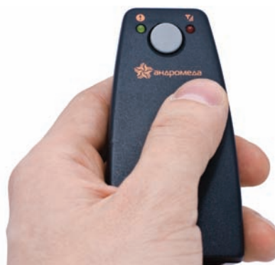
«Кнопка» тревожной сигнализации GSM