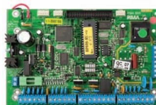
Контрольная панель Hunter-Pro