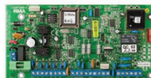
Контрольная панель Captain